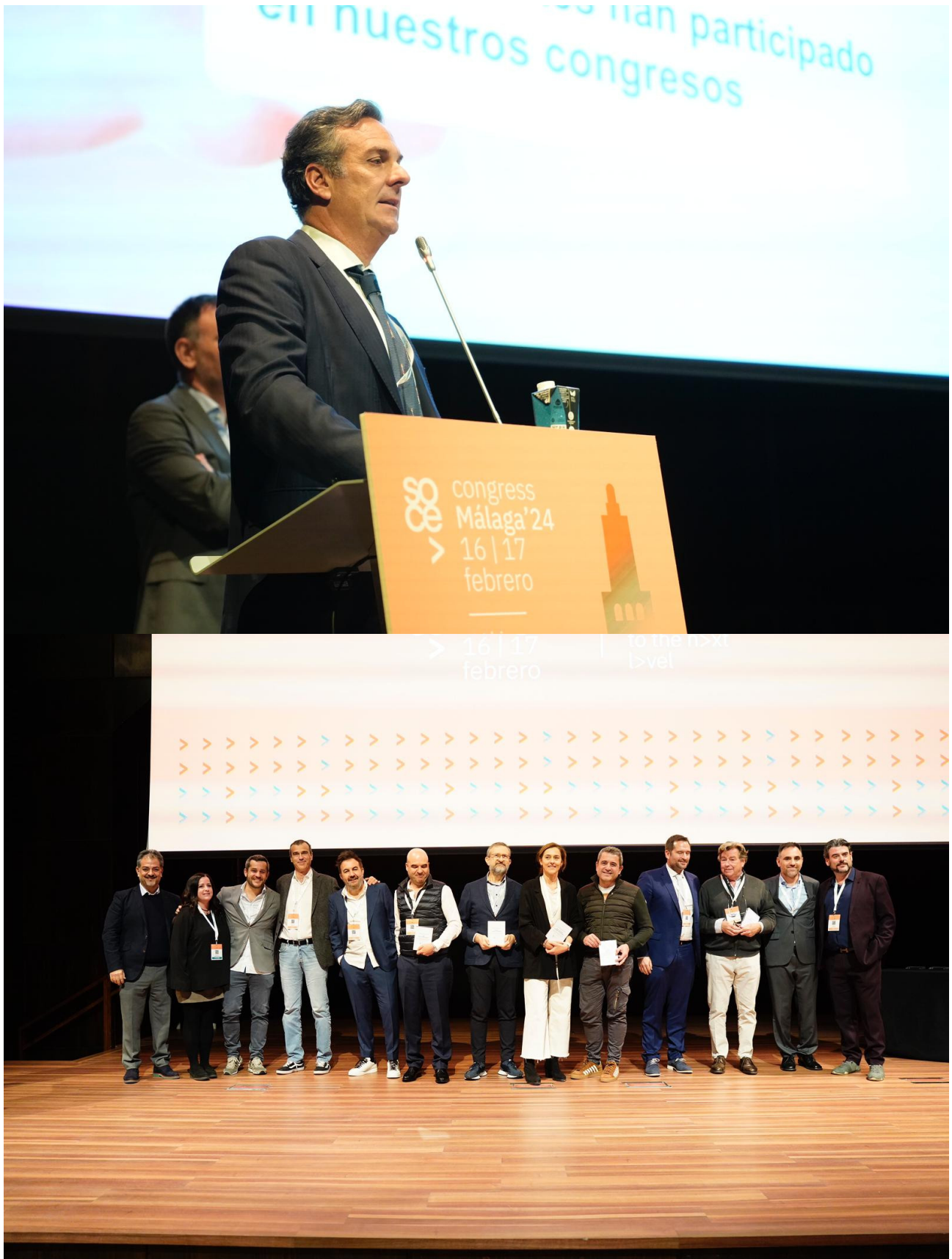
La Costa del Sol ha reunido a más de un millar de asistentes en el Palacio de Ferias de la capital con motivo de la celebración del XI Congreso de SOCE